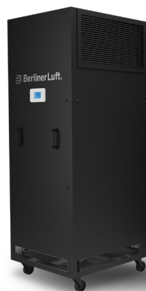
RAL 7012 (Basaltgrau)