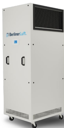
RAL 7035 (Lichtgrau)

Neben der Standardfarbe RAL 7035 (Lichtgrau) ist BerlinerLuft.Pure auch in weiteren Farboptionen erhältlich.